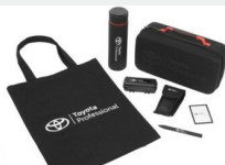
Zestaw prezentowy Professional Gadżety